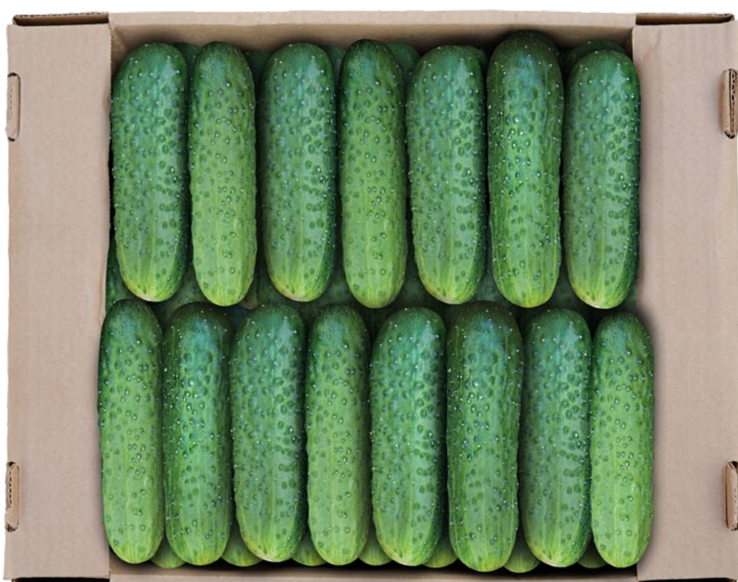
■ Paketim i përshtatshëm për Klasën Ekstra