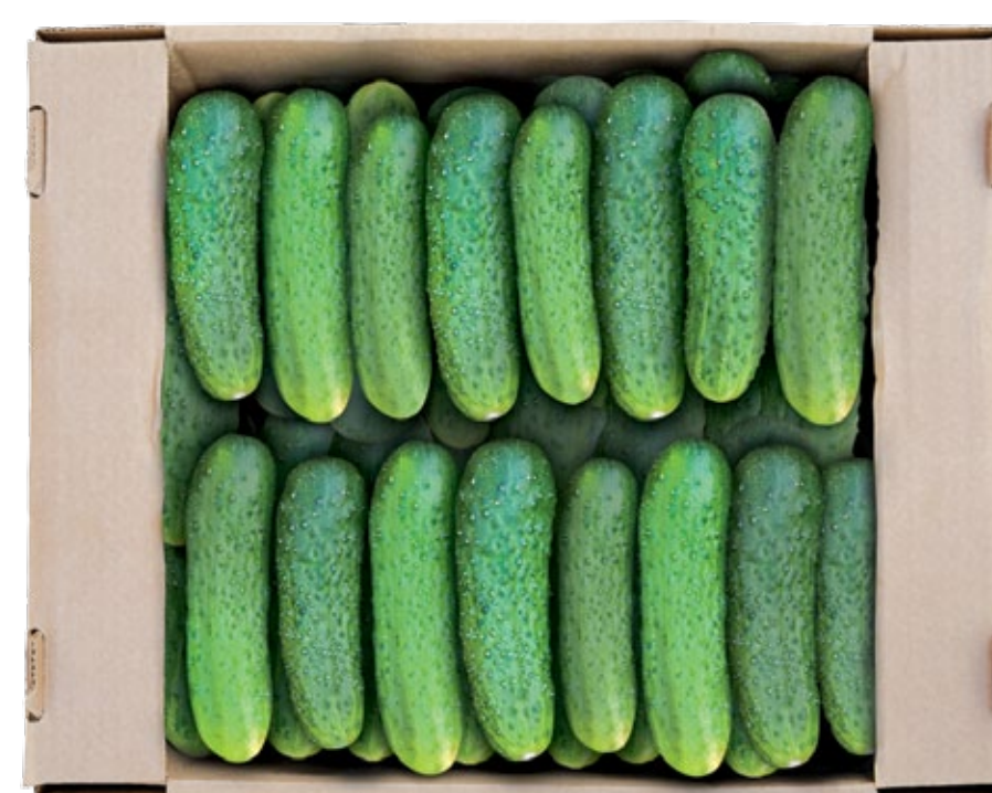
■ Paketim i përshtatshëm për Klasën I