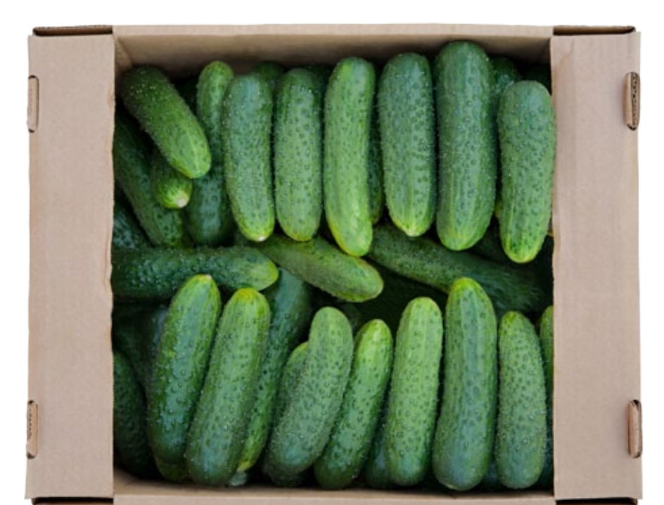
■ Paketim i përshtatshëm për Klasën II